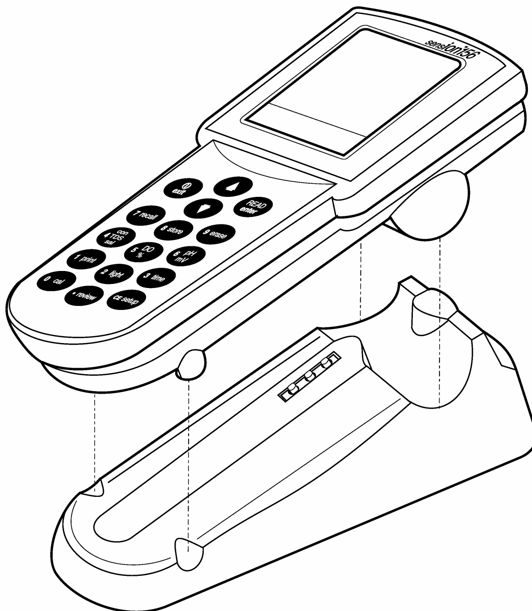
图 3 使用 sension 电源座